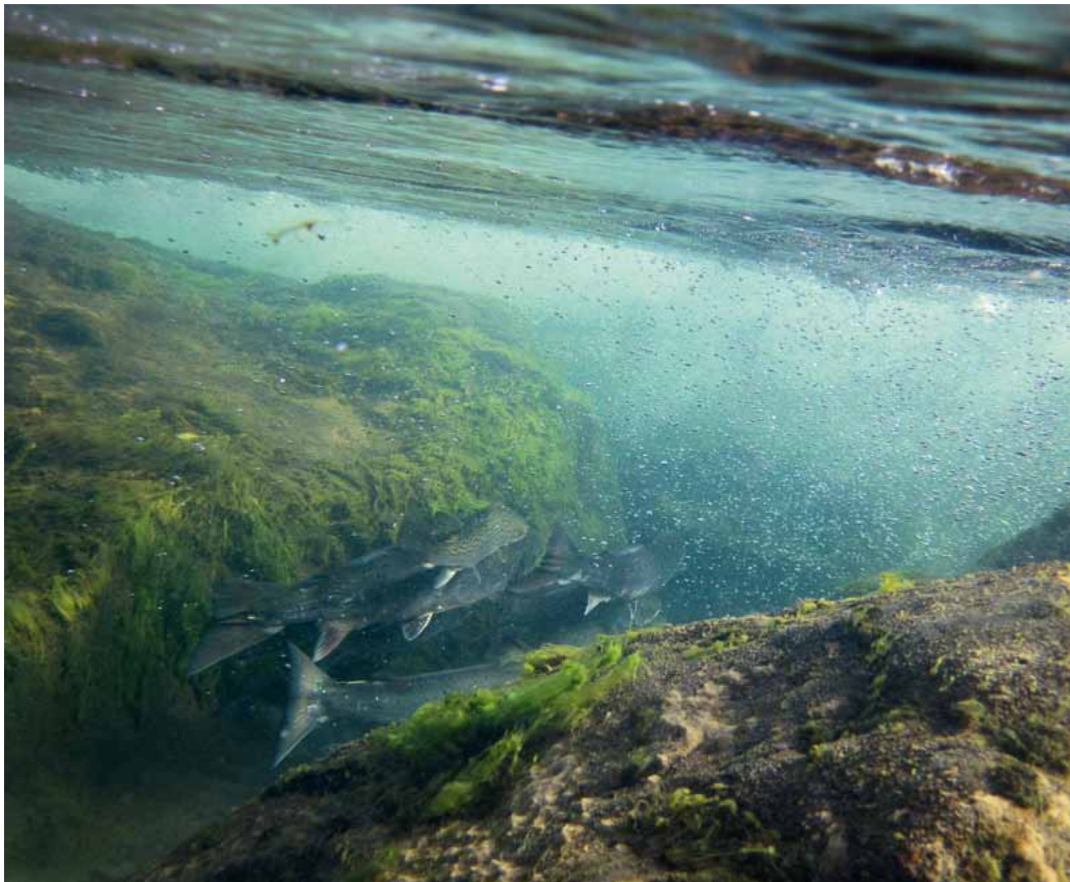
I en lille pool midt i Laxfoss hvilede en lille stime laks sig, før næste vandfald skulle forceres.

med stangen under armen. Da fluen er kommet halvvejs over, skubbes den op af en god trykbølge for at forsvinde i en stor hvirvel. En større laks tumler straks ud af vandet og lander hårdt på forfanget, som heldigvis holder til presset, men krogholdet slipper desværre. De næste par timer, indtil strømmen går i stå, har vi et rigtigt morsomt fiskeri med flere fine fisk på land.